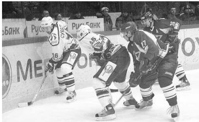
«Сибирь» (игроки в белой форме) загнана в угол...

Дальнейшее развитие ситуации носит полную неопределенность. «Сибирь», раздарив очки прямым конкурентам, занимает последнее место в турнирной таблице, и от зоны плей-офф нас отделяет 7 очков. Положение критическое, но не безвыходное. Глава попечительского совета губернатор Виктор Толоконский дал полный карт-бланш клубу, заявив, что требовать результатов от ко-