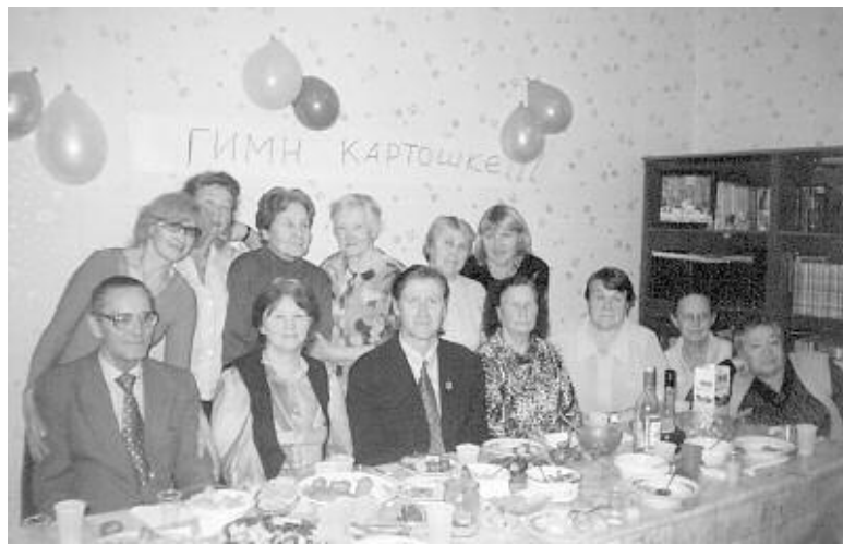
Участники конкурса «Гимн картошке».

Очень часто, выйдя на пенсию, человек замыкается в своем мирке, чувствует себя одиноким, никому не нужным. Между тем и в Новосибирске, и в районах области успешно работает немало различных общественных формирований, которые объединяют людей пожилого возраста. Одна из таких общественных организаций — Союз пенсионеров Центрального района Новосибирска .