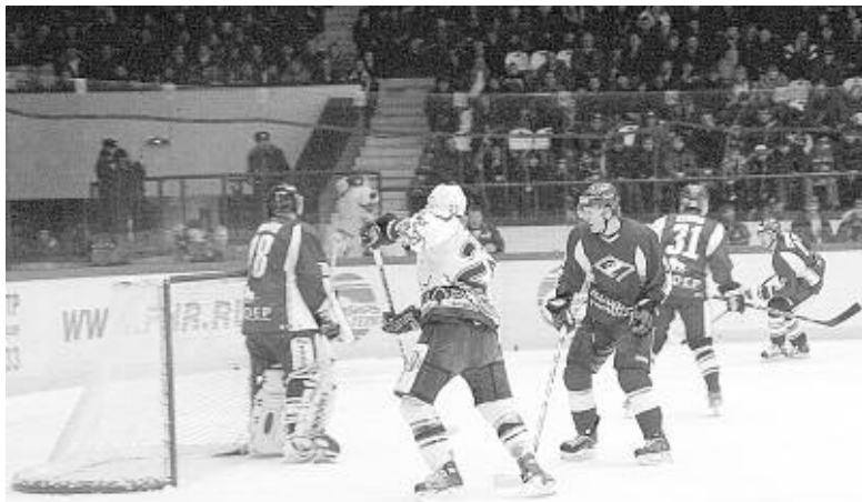
Один в поле — не воин...